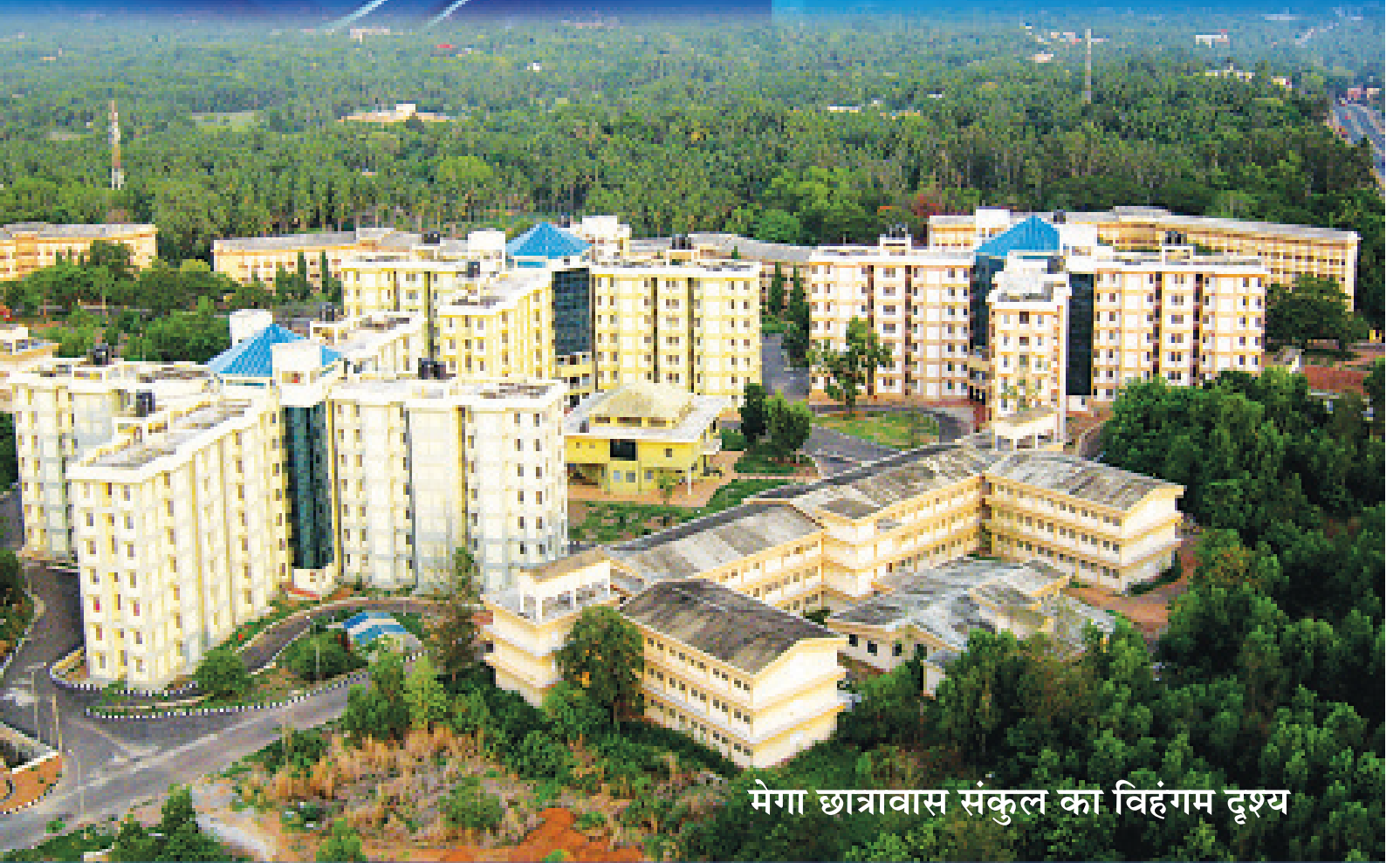
मेगा छात्रावास संकुल का विहंगम दृश्य

राष्ट्रीय प्रौद्योगिकी संस्थान कर्नाटक, सुरत्कल